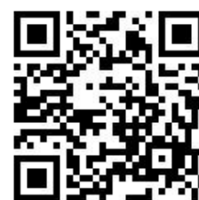
報名用 QR Code