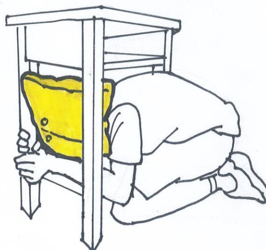
掩、穩 (頭部躲進桌內，抓緊桌腳)